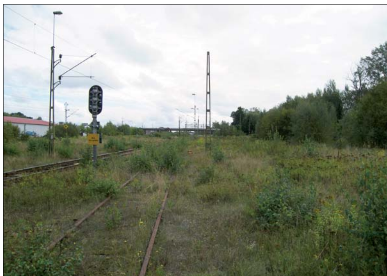
Figur 6. Bilden visar platsen för en tidigare kallkälla, objekt 5. Fotot är taget från väst.

FMIS. Informationssystemet om fornminnen, Nyköpings kommun, Södermanlands län. Riksantik-