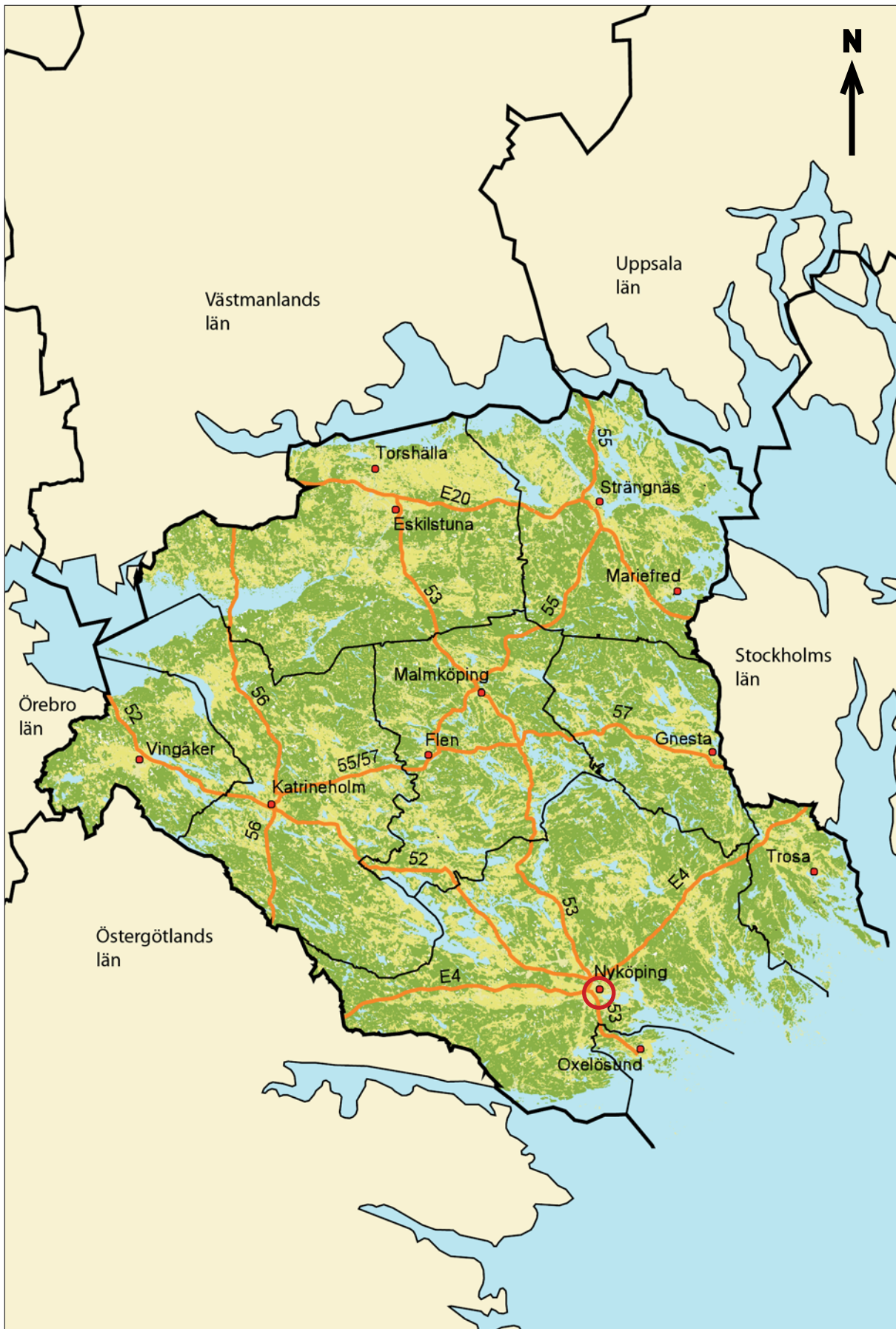
Figur 1. Översiktskarta över Södermanlands län med kommuner, större orter, vägar och angränsande län. Utredningsområdets geografiska belägenhet är markerat med röd kontur. Skala 1:800 000.