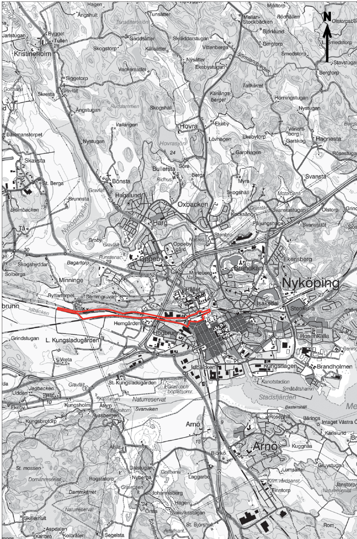
Figur 3. Utdrag ur Gröna kartans blad (GSD) Nyköping 9H SV med utredningsområdet markerat. Skala 1:50 000.