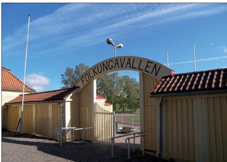
Figur 5. Folkungavallen är en idrottsplats från tidigt 1900-tal med flera arkitekturhistoriskt intressanta byggnader i nationalromantisk anda. Järnvägen går kant i kant med idrottsplatsens södra långsida.

Ytterligare lämningar utgörs av stenbrott, grustäkter, stenmurar, och husgrunder efter tidigare torpbebyggelse. Till torpen kan även ett antal odlingslämningar såsom röjningsrösen och fossil åkermark knytas. Slutligen kan omnämnas att det även finns rester efter