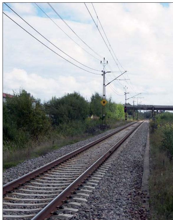
Figur 2. Befintlig järnväg väster om centralstationen. Bilden är tagen mot öster.

Samtliga påträffade fornlämningar, möjliga fornlämningar och övriga kulturhistoriska lämningar mättes in digitalt med handburen GPS och beskrevs i text. Ett representativt urval av lämningar, ytor, objekt etc. fotodokumenterades med digitalkamera.