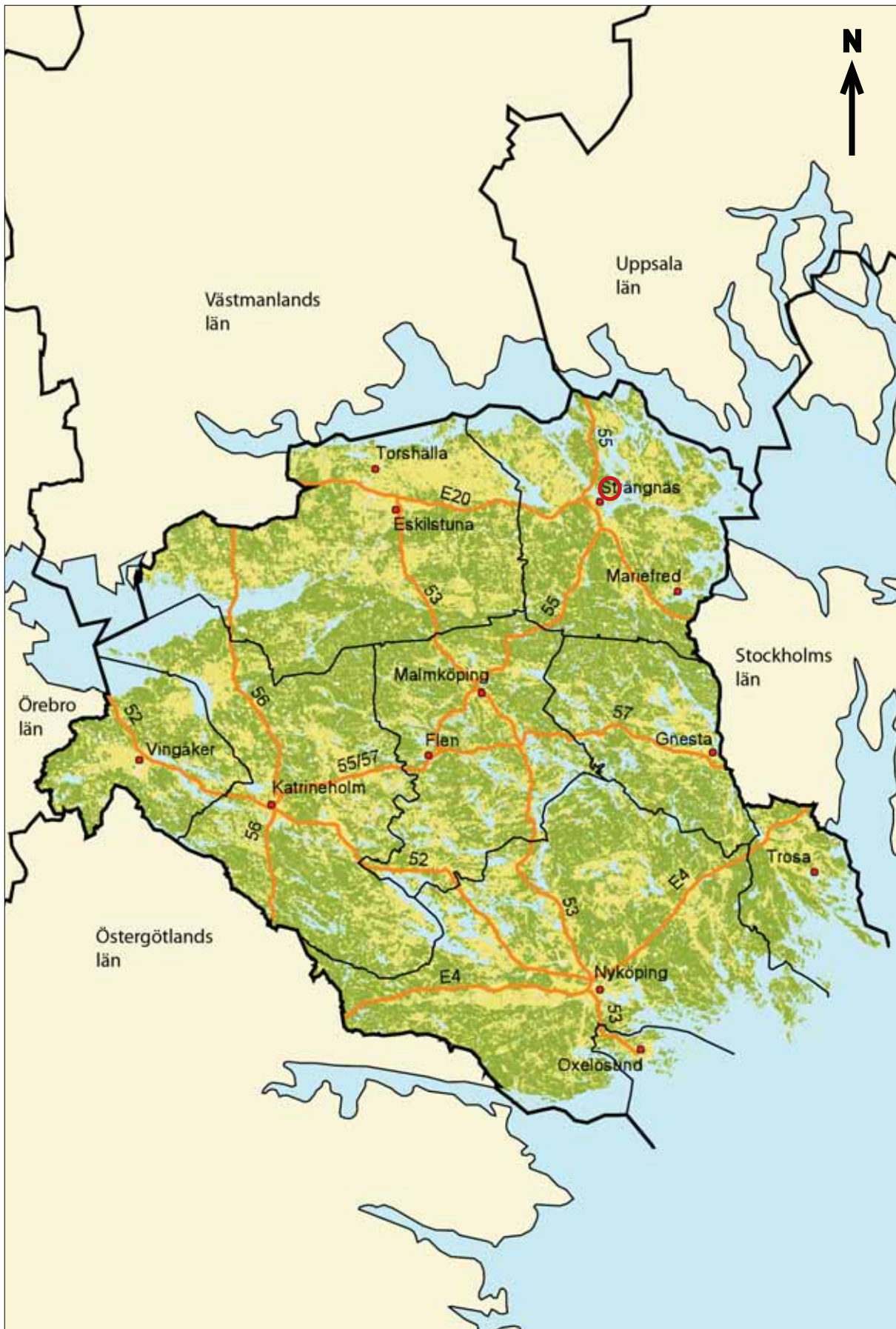
Figur 1. Översiktskarta över Södermanlands län med kommuner, större orter, vägar och angränsande län. Utredningsområdets geografiska belägenhet är markerat med röd kontur. Skala 1:800 000.