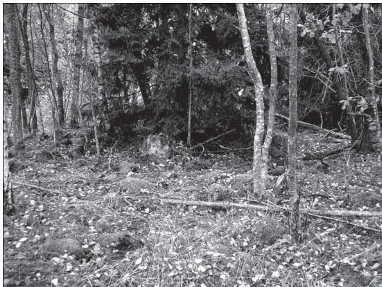
Figur 2. Figuren visar den möjliga stensättningen (objekt 1). På bilden syns det centralt belägna stenblocket i anläggningen. Bilden är tagen från NV.

Objekt 4. Bebyggelselämning. Objektet ligger strax öster om det inom utredningsområdet centralt belägna impedimentet/bergspartiet, strax väster om den mindre brukningsvägen/skogsvägen. Lämningen utgörs