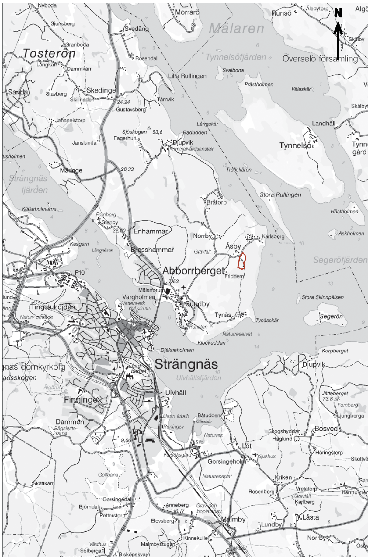
Figur 3. Utdrag ur Gröna kartans blad (GSD) Strängnäs 10H NV med utredningsområdet markerat. Skala 1:50 000.