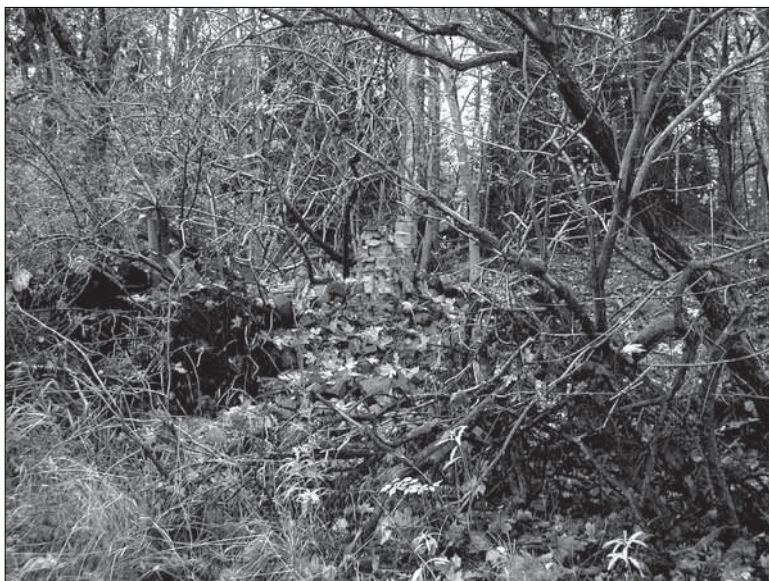
Figur 4. Bilden visar objekt 4. Centralt i bilden syns den delvis kvarstående skorstensstocken i tegel.

Inom området grävdes två sökschakt (S4 & S10) med hjälp av grävmaskin (se bilaga 2 & 3). Jordmånen